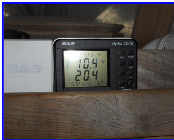
Puntas de 10 nudos, todo un lujo de despedida..

Todos nos apresuramos a llamar...la emoción era máxima. Abrazos, celebraciones y brindis...estábamos a punto de conseguirlo, ese sueño, ese reto...estaba a unas pocas horas y a escasas 20 millas de distancia... No me lo podía creer.