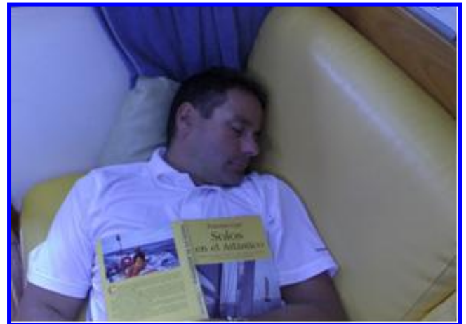
Una merecida siesta, con la lectura idónea.