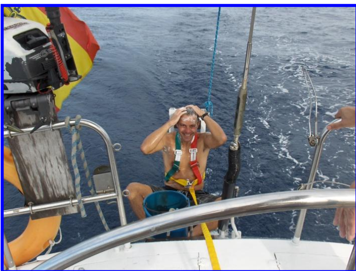
La higiene diaria, fundamental.

Finalmente, después de 7 días desde nuestra salida, unas 900 millas, y cruzado el Trópico de Cáncer, llegamos a Cabo Verde. Los dos días de encalmadas habían vaciado el 50% del combustible, y de cara a afrontar la siguiente etapa (2.000 millas) era necesario repostar. Tras 4 horas en Cabo Verde, continuamos ya de noche rumbo directo a Martinica. Ya estábamos en el paralelo 15. Una cierta euforia se apoderó de todos... la próxima parada, sería nuestro destino final, Martinica, aunque aún quedaban unos 15 días de travesía.