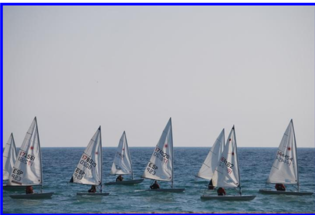
Un entreno de láser con mis compañeros de flota

Lo primero, buscar barco y patrón. No hay muchas empresas o patrones que de forma organizada ofrezcan este tipo de viajes. Pero localicé una, Delta Yacht Cruisers, que ofrecía plazas para cruzar el Atlántico en Noviembre.