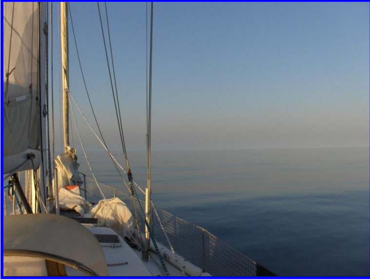
Una encalmada, camino de Cabo Verde.

Los primeros días, rumbo a Cabo Verde, tuvimos un buen viento del Norte, que impulsaba al velero hasta los 7,5 nudos... y todo iba perfecto. La convivencia, los turnos para las guardias, la organización de las comidas... El barco disponía de una cocina con horno y 3 fuegos y permitía cocinar –con las limitaciones propias del espacio- casi de todo: pasta, verdura, arroces, pescados al horno.. etc. Íbamos a buen ritmo, aunque la ruta por Cabo Verde incrementaba la distancia total en unas 400 millas, y por tanto, el tiempo total. Todos teníamos intención de llegar a casa por Navidad... y con este cambio de ruta, sería muy justo.