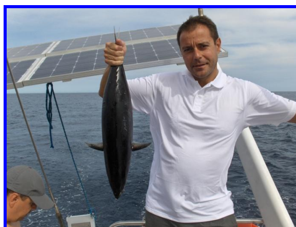
Un precioso atún de 4,5kg, con el que hicimos un Marmitako estupendo, y los delfines, que nos acompañaron durante casi toda la travesía, además de un cachalote (no llegamos a tiempo de inmortalizarlo)

En ruta ya hacia Martinica, tuvimos 2 días y medio seguidos de mala mar...no puede decirse que fuera un temporal. Afortunadamente, no llovió, pero teníamos vientos de 30-35 nudos que entraban por popa, que unidos a una mar cruzada, hacían que el barco no parase de dar pantocazos. Olas de 5 metros nos golpeaban por babor y estribor, haciendo muy incómoda la travesía. Dormir era imposible, y cualquier tarea como ir al lavabo, moverse por el barco, cocinar...era realmente complicado.