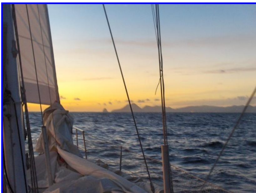
Tierra a la vista...tras 21 días de navegación!!!!

de incertidumbre en el puerto, ya que el motor de la auxiliar se paró, y llovía con una cierta intensidad, conseguimos llegar al restaurante de la marina. Curiosamente, no tuve esa sensación de mareo que cuentan los que han estado muchos días en el mar, y que parece que todo se mueva...creo que nos podían las ganas de darnos un buen homenaje.