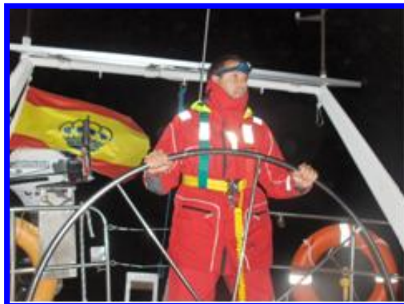
Durante una guardia nocturna.